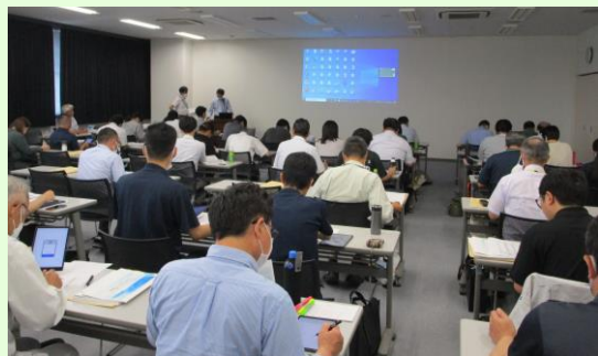
タブレット操作研修会場の様子